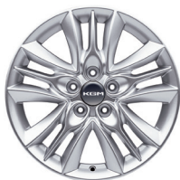
17" ALU kola, pneumatiky 225/60 R17