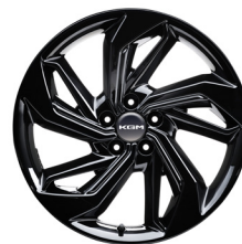
19" ALU kola, „Diamond Cutting“, pneumatiky 235/55 R19