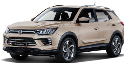
LATTE béžová (EBL)