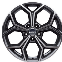
18" ALU kola, „Diamond Cutting“, pneumatiky 235/55 R18