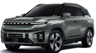
FOREST zelená (GAO)