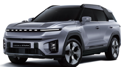
IRON kovová (ADE)