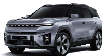
IRON kovová s černou střechou (2DE)