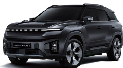
SPACE černá (LAK)