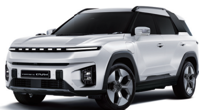
GRAND bílá (WAA)