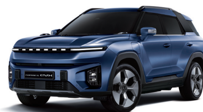
DANDY modrá (BAS)