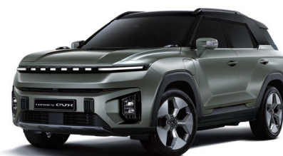
FOREST zelená s černou střechou (2GO)