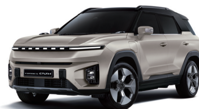
LATTE béžová s černou střechou (2BL)