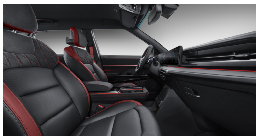
Černá kůže s červeným semišem (LCX)