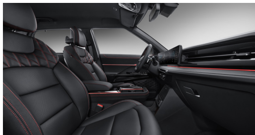
Černá kůže (LDB)