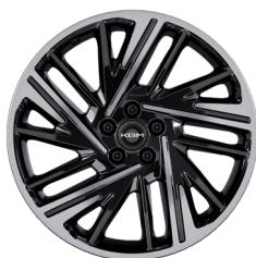
20" ALU kola „Diamond Cut“, pneumatiky 245/45 R20