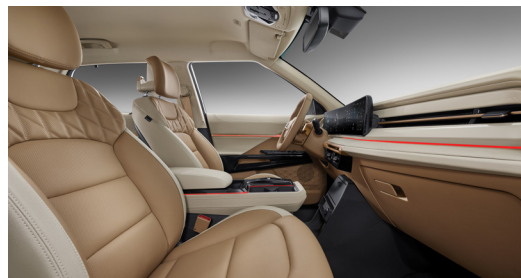
Dvoutónová kůže béžová (EBO)