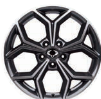
18" ALU kola „Diamond Cutting“, pneumatiky 235/55 R18