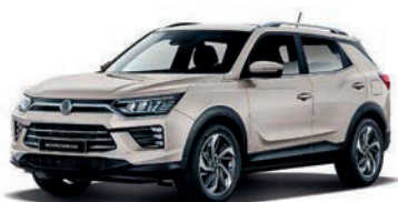
LATTE béžová (EBL)