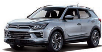
IRON kovová (ADE)