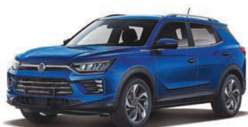
DANDY modrá (BAS)